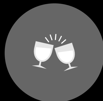
A & B